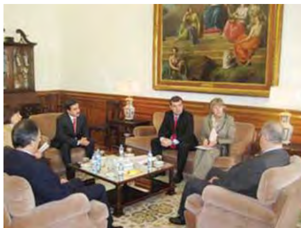
Gabinete da Presidência da Assembleia da República