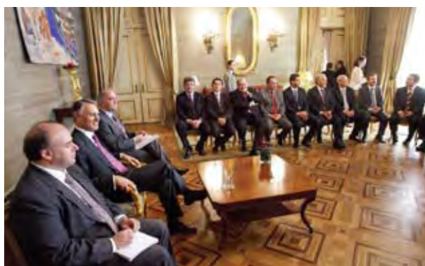
Presidência da República

A 23 de Fevereiro de 2011, o Presidente da República, Prof. Aníbal Cavaco Silva, recebeu em audiência conjunta, as direcções da Associação Nacional de Municípios Portugueses (ANMP) e das Associações de Municípios das Regiões Autónomas da Madeira e dos Açores.