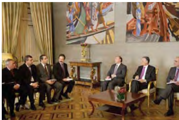
Presidência da República