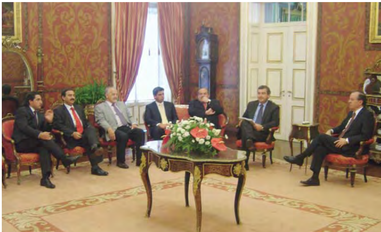
Gabinete do Representante da República para a Madeira